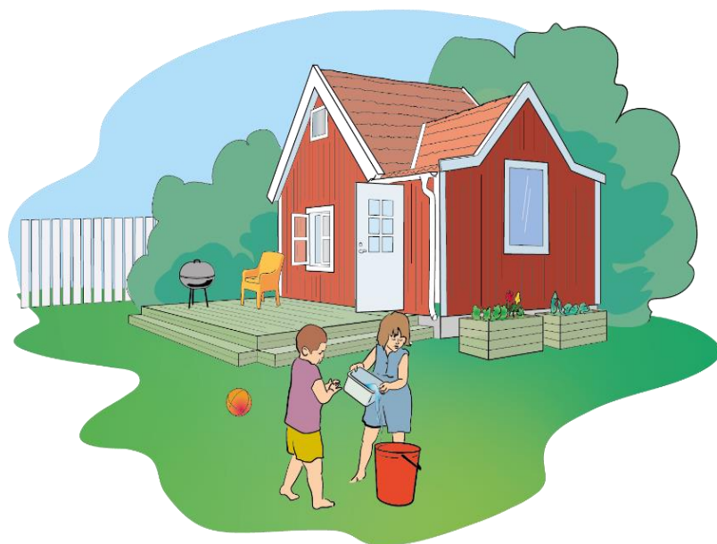
Altantrall och pallkragar med CCA-impregnerat trä.

Trä impregnerat med CCA kan ha en grönaktig färg på grund av kopparsalter. Åldrat virke med CCA kan ha förlorat sin gröna färg, men ändå ha kvar mycket av impregneringsmedlet.