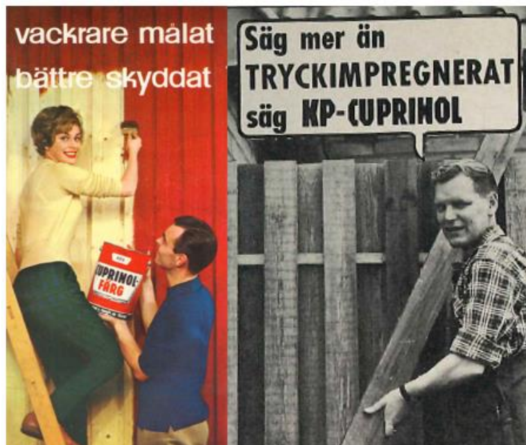
1960-tals reklam för produkterna Cuprinol-färg och KP-cuprinol innehållande klorfenoler.

Produkter med klorfenol kan ibland vara svåra att identifiera eftersom klorfenolerna saknar färg och vissa produkter var färglösa. Många produkter hade dock färg på grund av andra innehållsämnen, exempelvis de två medel som huvudsakligen användes vid industriell impregnering: BP-Hylosan (klorfenoler i olja, brunaktig färg) och KP-Cuprinol (salter av klorfenoler och koppar i vattenlösning, grönaktig färg). Klorfenolerna förbjöds i Sverige år 1977 och 1979 hade alla