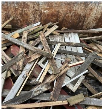
Inlämnat impregnerat trä på kommunal återvinningscentral.

Luktproblem inomhus kan bero på andra orsaker än gamla träskyddsmedel. Problematisk lukt kan också vara orsakad av andra fuktrelaterade problem, avlopp, byggnadsmaterial eller pågående verksamheter i byggnaden. Problem med lukter är vanligt i samband med byggnadsrelaterad ohälsa. Mer information om byggnadsrelaterad ohälsa finns i faktablad från Arbets- och miljömedicinska klinikerna i Stockholm respektive Göteborg (se referenslistan).