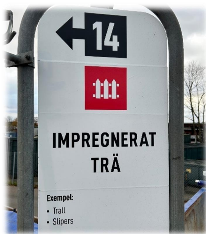
Sydskånes avfallsaktiebolags (Sysav) skyltning med symbol för avfallstyp impregnerat trä på återvinningscentral.

Har du frågor eller behöver veta var du kan lämna impregnerat trä, kontakta din kommun eller lokala återvinningscentral.