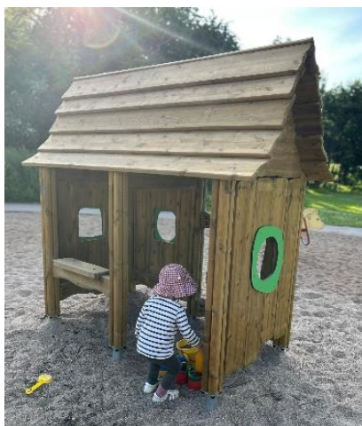
Lekutrustning av behandlat trä med kopparbaserat träskyddsmedel.

De moderna kopparbaserade träskyddsmedel som används idag till altaner och andra träkonstruktioner innehåller kopparsalt men varken arsenik eller krom. Att såga eller slipa i kopparimpregnerat trä genererar trädamm. För privatpersoner som utför sådant arbete vid enstaka tillfällen blir exponeringen för koppar lägre än vad som förväntas orsaka irritations-effekter.